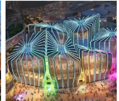
Qiddiya E-Sports Arenas SAOEDI-ARABIË