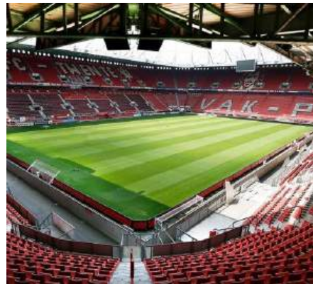
Grolsch Veste NEDERLAND