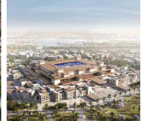
Jeddah Central Stadion SAOEDI-ARABIË