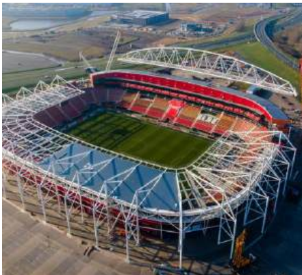
AFAS Stadion NEDERLAND