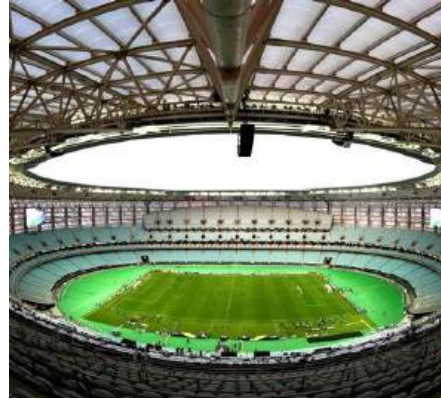
Bakoe Olympisch Stadion AZERBEIDZJAN