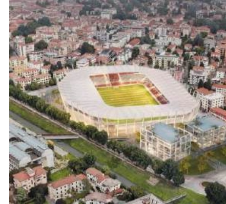
Romeo Menti Stadion ITALIË