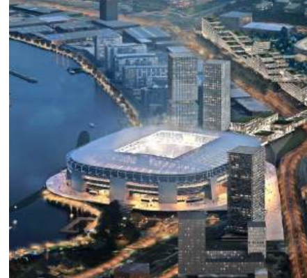
Feyenoord City NEDERLAND