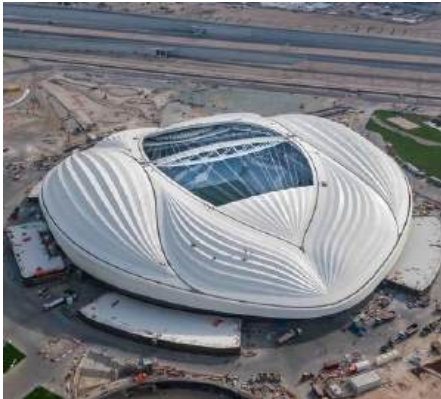
Al Janoub Stadion QATAR