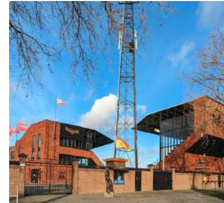
De Adelaarshorst NEDERLAND